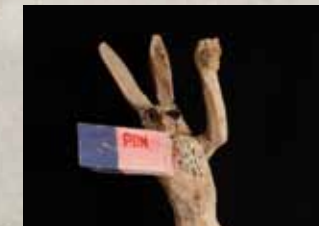
PEER OLIVER NAU