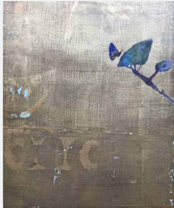
Sibylle Prinzessin von Preußen: of eden - butterfly, 2019

Zwei Künstlerinnen und drei Künstler werden in der Ausstellung KRAFT-WERK-KUNST ihre Positionen vorstellen: Die vielseitig arbeitende Künstlerin Friederike Krusche präsentieren wir in der Galerie zum ersten Mal mit einer Anzahl von sensiblen, abstrakt-farbigem Mischtechniken, die in aufwendigen Arbeitsprozessen entstehen.