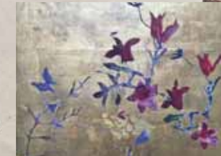
SIBYLLE PRINZESSIN VON PREUßEN