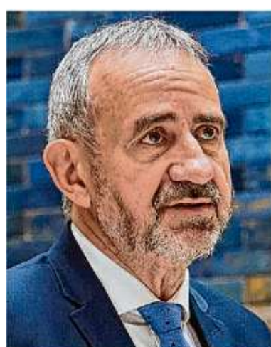
Spricht von einem historischen Schritt: Hermann Parzinger, scheidender Präsident der SPK