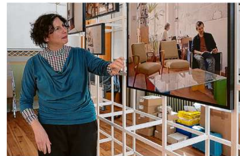
Intime Einblicke: Bettina Cohnen fotografierte Menschen in Wohnvierteln der Berliner Nachkriegsmoderne.